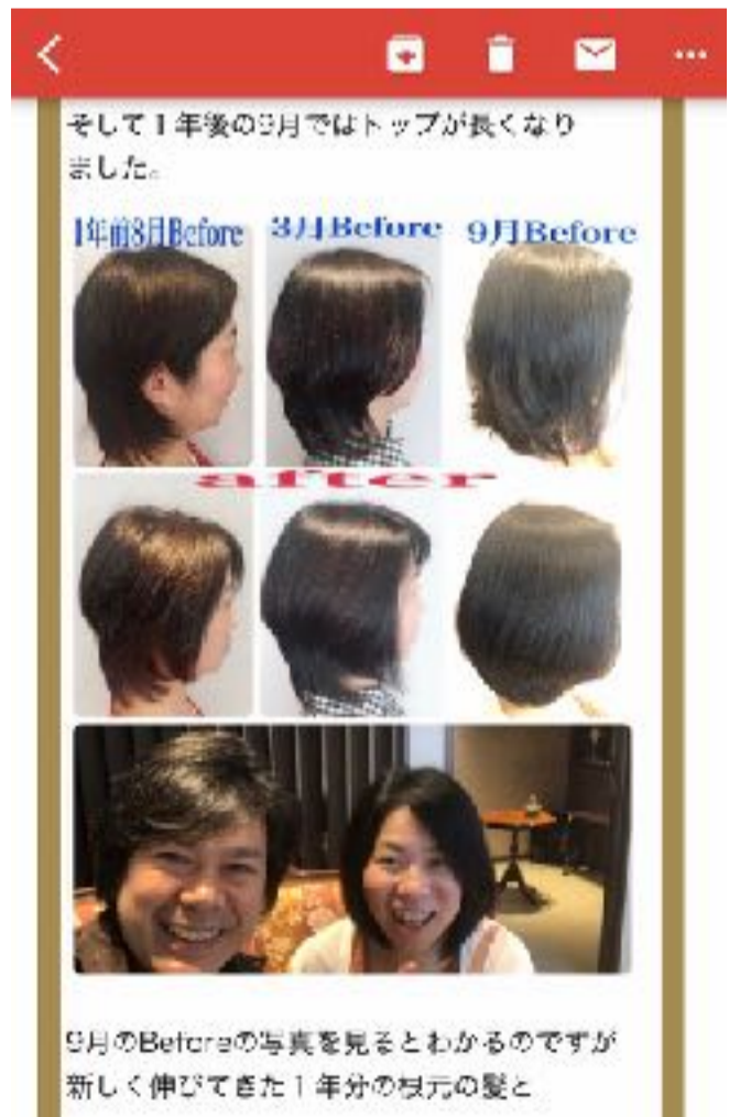
9月のBeforeの写真を見るとわかるのですが新しく伸びてきた1年分の枝元の髪と